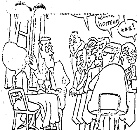
„Visa franču revolūcijas sūrija iet vaļā, ja mēs restorānā tikai mazliet pa- veram logu avaišam gaisam...”