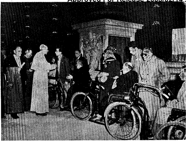
Sua Santità si informa amorevolmente dei condizioni degli invalidi di Toscani venuti a Roma per il Giubileo

Approved For Release 2005/02/14 : CIA-RDP83-00415R007000120096 4