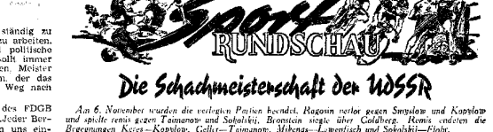
Am 6. November wurden die letzten Partien beendet. Hasezin verlor gegen Smyslov und Kasparov...