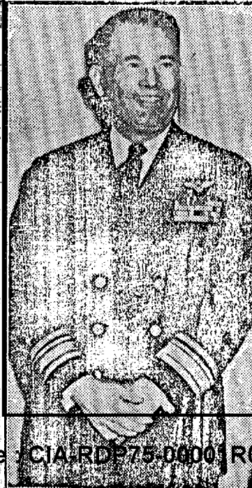
William F Raborn, 59, är ny chef för USA:s "osynliga regering" — underrättelsetjänsten.