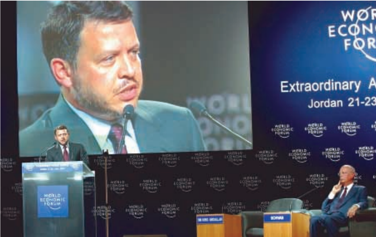
الشونة (البحر الميت)

تعتقد اللجنة الرباعية اجتماعاً اليوم في الأردن بخصوص لاعطاء دفعة لخريطة الطريق، مع احتمال طرح تصور مماثل يخص المسارين اللبناني والسوري، في وقت لفت الانتظار حضور وفد من رجال الأعمال السوريين الى القمة الاستثنائية لمنتدى الاقتصادي العالمي، في منطقة الشونة على البحر الميت. ومن المنتظر ان يقدم بول بريمر، الحاكم المدني للعراق، في خطاب مفصل يلقيه ظهر اليوم، صورة عن الأوضاع في العراق ويشرح فيه توجهات الادارة الاميركية في هذا البلد. واجرى العاهل الاردني الملك عبد الله الثاني محادثات مع وزير الخارجية الاميركي كولن باول والحاكم الاميركي في العراق بول بريمر، داعياً الى تحقيق تقدم ملموس، في تطبيق «خريطة الطريق» وضمان الامن في العراق. وشدد على ضرورة اتخاذ خطوات عملية تعزز بناء الثقة بين الجانبين الفلسطيني والاسرائيلي وتفسح الطريق لتطبيق خطة السلام، وأكد باول «التزام الولايات المتحدة العمل للتوصل الى سلام دائم بين الفلسطينيين والاسرائيليين بنهي الاحتلال الاسرائيلي ويفضي الى قيام دولة فلسطينية مستقلة».