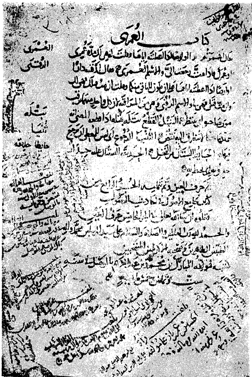
راموز الصفحة الأخيرة من نسخة المؤلف بخطه