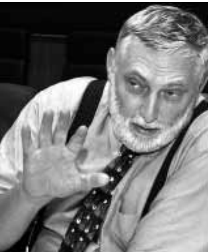
المفوض الزراعي الأوروبي فرانز فيشلر. (أ ب)

عقدت أول من أمس في واشنطن، وقال بيان صدر عن البيت الأبيض أن الرئيس بوش ورئيس المفوضية الأوروبية رومانو برودي وضعان مسالة تطوير اقتصاد قائم على الهيدروجين نصب أعينهما. وتعتبر هذه المسألة من المسائل المهمة في نظر الرئيس بوش الذي يكره على مسامح المسؤولين الإحسان الذين يزورون واشنطن دعوتهم ابهام إلى الانضمام إلى جهود الولايات المتحدة على هذا الصعيد. وأضاف البيان أن التعاون بين الولايات المتحدة والاتحاد الأوروبي لتطوير اقتصاد قائم على الهيدروجين من شأنه أن يقدم دعماً راسخاً للشراكة الدولية في هذا المجال. وكان بوش أطلق مبادرة هذه الشراكة في الربع الماضي. وأعلن أيضاً مطلع السنة أن ادارته ستستخض في السنوات المقبلة ١.٢ بليون دولار لتطوير التكنولوجيا التي تستخدم الهيدروجين مصدراً للطاقة.