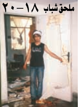
ملحق شباب ٢٠-١٨