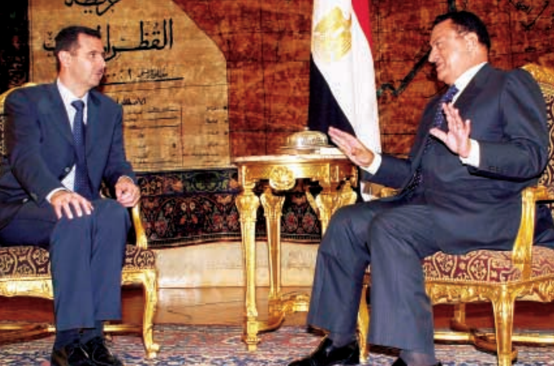
الرئيسان مبارك والأسد خلال لقائهما أمس في القاهرة. (١ ب)

القاهرة - محمد الشاذلي القدس المحتلة - سائدة حمد الناصر - أسعد تلحمي الرياض - «الحياة» طالبت القمة المصرية - السورية التي جمعت الرئيسين حسني مبارك وبشار الأسد في القاهرة أمس بإنهاء احتلال العراق والأراضي الفلسطينية، داعية اللجنة الرباعية الدولية إلى العمل من أجل تحريك المسارين السوري واللبناني. (راجع ص ٥ و ٦) وعلى المسار الفلسطيني، نوه مجلس الوزراء السعودي بجدية موقف السلطة في التعامل مع «خريطة الطريق»، مطالباً المجتمع الدولي، وواشنطن خصوصاً، بالتعامل مع ذلك بجدية متساوية. في غضون ذلك، تكثفت اللقاءات الفلسطينية - الإسرائيلية أمس، معطية الانطباع بأن تنفيذ «خريطة الطريق» يسير بشكل إيجابي، على رغم أن الواقع على الأرض يسير على نحو مغاير. ففيما عقد الجانبان ثلاثة اجتماعات في القدس المحتلة لمناقشة قضايا الاسرى، ومكافحة التحريض المتبادل، واستئناف العلاقات الاقتصادية، شنت إسرائيل حملة اعتقالات في الضفة طاولت ناشطين من «حماس»، كما جددت رفضها تنفيذ انسحابات جديدة من مدن فلسطينية أخرى، ورهنت ذلك بشروع السلطة في تجريد فصائل المقاومة من سلاحها. مهمة «حماس» باستغلال الهدنة لاستجماع قواها وتسريع تسليحها تمهيداً لاستئناف التتمة في الصفحة (٦)