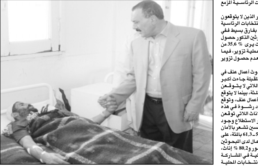
الرئيس اليمني علي عبد الله صالح يزور احد المصابين بحادث التفجير

ديي-رويتزر: قالت جماعة عراقية متحزجة رجلا تركيا رهينة في بيان انها ستقتله خلال 72 ساعة ما أعاها ما لن تجبر أنقرة الشرطة التركية على العمل بها على وقف نشاطها في العراق. جاء ذلك في بيان وضع على موقع على الانترنت اس حضور مهرجانات مرشح المعارضة بن شمالان في اربيل - ا ف ب: وصل السفير الامريكي لدى العراق زماي خليل زاد الى اقليم كردستان العراق بعد ظهر امس الاربعاء في زيارة تستمر يومين يلتقي خلالها رئيس الاقليم مسعود البارزاني. وقور وصوله الى مطار اربيل (350 كم شمال بغداد)، اشاد امام الصحفيين بالتطور الاقتصادي الحاصل في الاقليم قائلا ان «التطورات الحاصلة فرصة لتطوير اقتصاد البلد وتنمى الاستفادة من الاستثمارات الحاصلة لاجراء سوق تجارية في المنطقة».