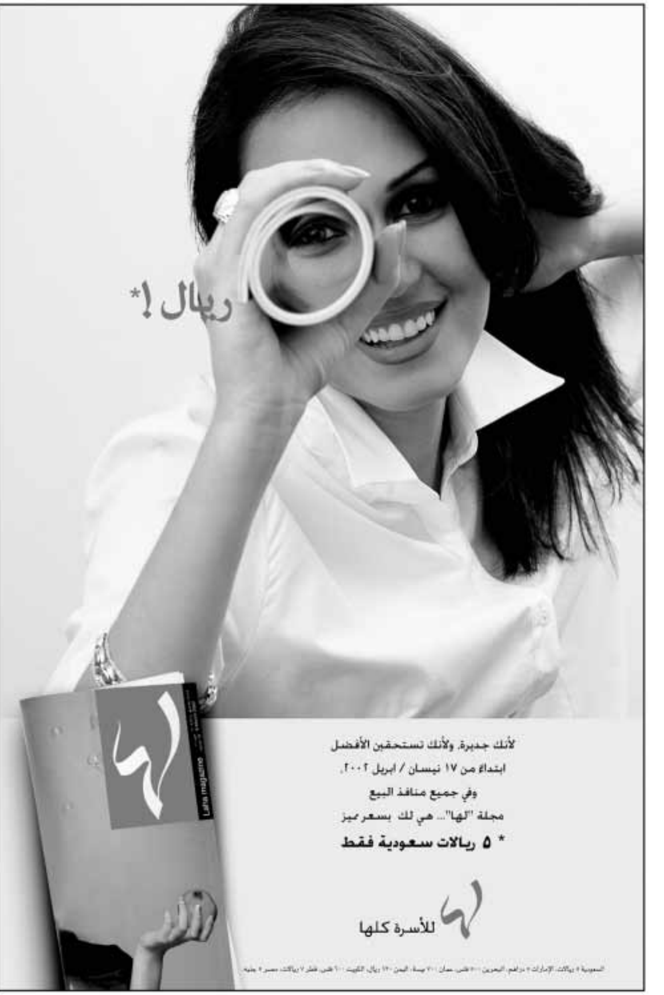
5 ريال سعودي فقط... هي لك بسعر ميمز مجلة 'لها'... في جميع منافذ البيع ابتداء من ١٧ نيسان / أبريل ٢٠٠٢.