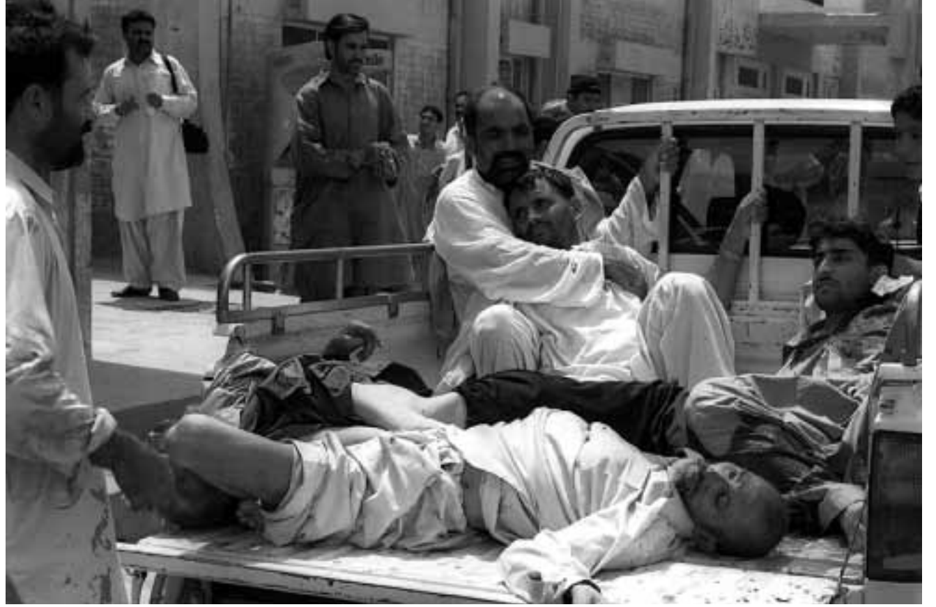
قتلى وجرحى اثناء نقلهم من موقع الانفجار.

واوضح مسؤولون فى وزارة الدفاع ان الجنرال جيمز جونز تلقى تعليمات بتقوم