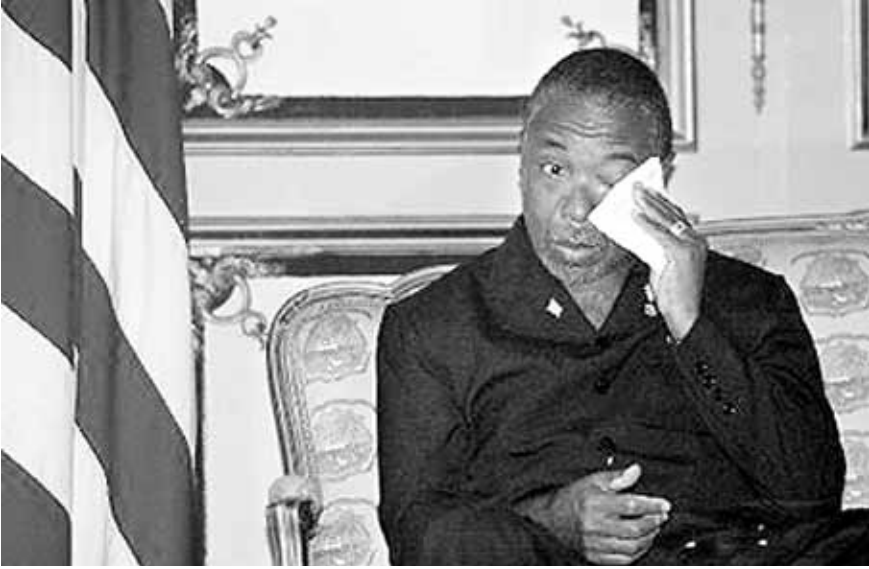
الرئيس الليبيرى فى القصر الرئاسى امس.

مشاركة عسكرية محتملة للقوات الاميركية فى قوة حفظ السلام فى ليبيريا. وانقسم المسؤولون الاميركيون فى ما بينهم حول جدوى إرسال جنود الى ليبيريا. وأحد مسؤولون ان وزير الدفاع دونالد رامسفيلد يعارض إرسال قوة اميركية، فيما يتشاور وزير الخارجية كولن باول مع دول