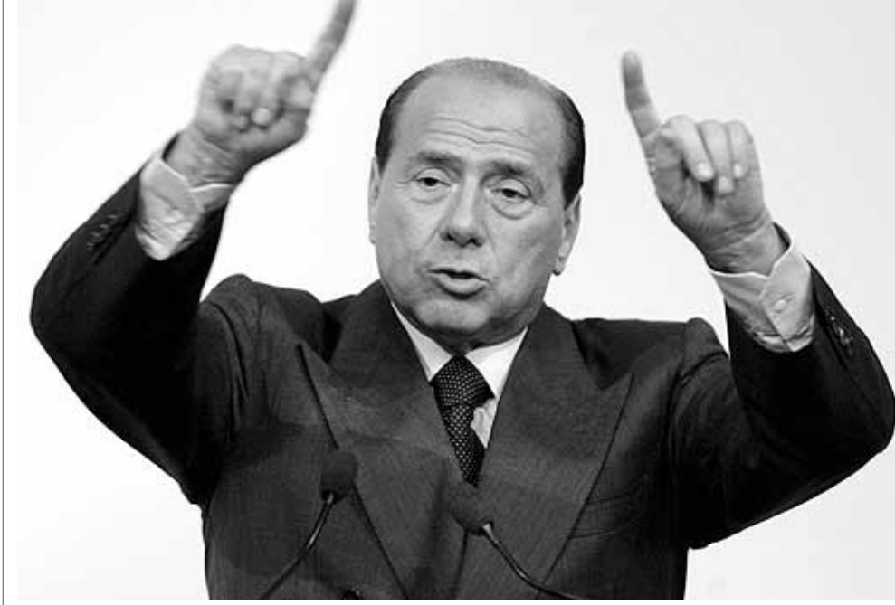
برلوسكوني عقب لقائه المفوض الأوروبي فى روما امس. (رويترز)

● تايه - رويترز - استبعد الرئيس التايوانى شين شوي بيان استئناف المحادثات المتوقفة مع الصين قبل انتهاء فترة رئاسته فى العام المقبل، مشيراً الى تشفى مرض التهاب الجهاز التنفسي الحاد (سارز) واعتراض بيكن على انضمام تايوان الى منظمة الصحة العالمية كسبب رئيسى لذلك. وقال شين ان سلسلة من الخطوات غير الودية التي قامت بها الصين اثبتت ان بيكن لا يريد بصدق استئناف الحوار مع تايوان وان اي تحسين فى العلاقات بين الجانبين لا بد من ان ينتظر الى ما بعد الانتخابات الرئاسية فى آذار (مارس) المقبل.