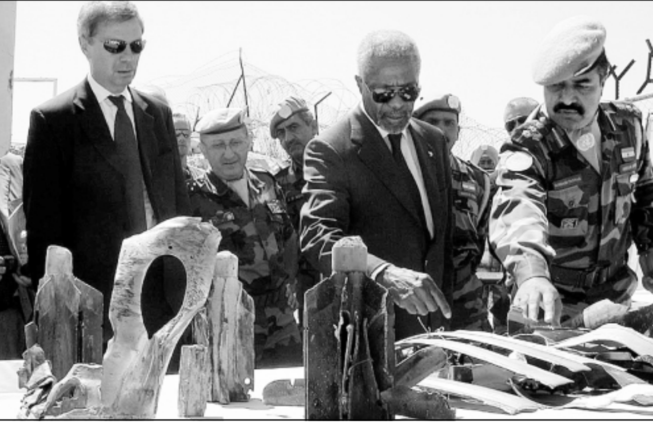
كوفي عنان يتفحص قطعاً من القذائف والصواريخ الاسرائيلية التي سقطت على قرية مركبة في الجنوب اللبناني

التذكاري لشهداء «اليونيفيل» في الناقورة، وقدمت فرقة فرمزية من جنود وضباط القوات الدولية التحية العسكرية، وكانت قيادة اليونيفيل وضعت صور تشيهداء لها، وهم اربعة ضباط سقطوا خلال العدوان الاسرائيلي على الجنوب، بالإضافة الى صورة موظف غاني قتل وزوجته في بلدة الحوش في صور، واقدم عنان والوفد المرافق حفل غداء في المقر العام لـيونيفيل، توجه والوفد الى مستشفى وكبار الضباط خلاله الى المسؤوليين وكبار الضباط في المنطقة، ثم قام عنان بجولة في قرى وبلدات الجنوب فحصت طوافه تابعة للقوات الدولية تقل عنان في مهبط خاص للفرقة الواقعة في بلدتي حولا ومرصيا مقابل موقع العبيد الاسرائيلي، ومنها انطلق في موكب يضم 10 سيارات باتجاه