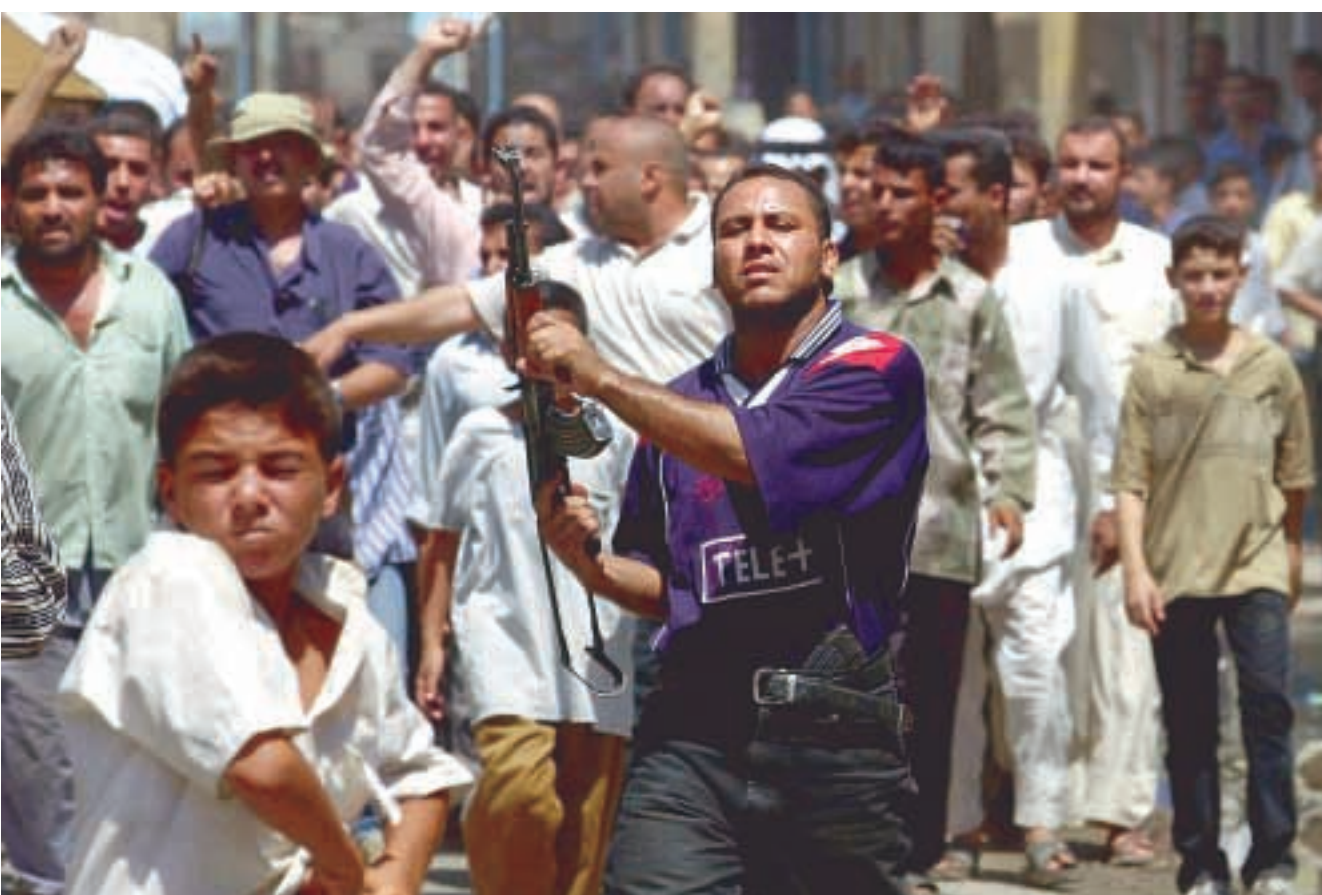
عراقيون في بغداد خلال تشييع جندي سابق قتل في المواجهة مع الأميركيين الاربعاء. (٦ أ)