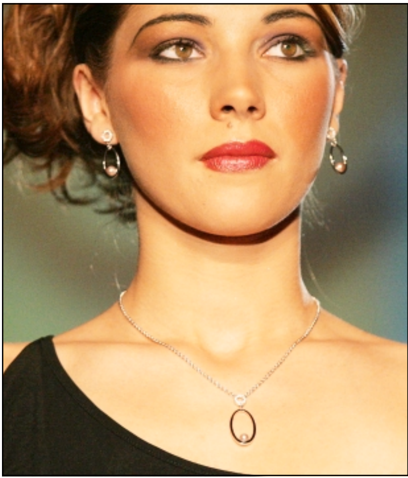
ضمن عرض للأزياء والمجوهرات أقامته مجلة «دزيريات (جزائريات)» في العاصمة الجزائرية جاء هذا العرض لمجموعة من المجوهرات الثمينة (أ ف ب)

■ ميامي - يوبي أي: تنهات الطبليات على شركات دفن الموتى من قبل الأمريكيين الذين يرغبون في تشييد قبور ممتدة لهم تتحدى عوامل الزمن، وتتيح لأولادهم وأحفابائهم زيارتها من أجل تذكرهم بعد رحيلهم عن هذا العالم. وقال مسؤول في أحد شركات دفن الموتى ان الأمريكي لا يهتم الآن كيف يرقده تحت التراب بقدر ما يحرص على أن يكون له قبر متين البناء يمكن تمييزه من بين الكثير من القبور. ودفعت موجة الفيضانات والأعاصير التي ضربت الولايات المتحدة مؤخراً الكثير من الأمريكيين للتعاقد مع شركات دفن موتى من أجل بناء قبور قوية لا تجرفها المياه القوية ولا تتأثر بعوامل الطبيعة. ويحرص الكثير من الأمريكيين على بناء قبور لهم من الغرانيت تزينها رسومات، ويتم المحافظة عليها طول الوقت. وقال ايد بيك من فلوريدا «لا نريد أن ندفن في مكان ثم ننهي في مكان آخر مليء بالأعشاب ويحسب لنا». ويبلغ البذخ ببعض الأمريكيين حد تخصيص مبالغ تصل الى مليون دولار لضمان أنه ستكون لهم قبور صامدة في وجه عوامل الزمن والنسيان.