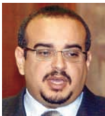
الشونة (الأردن) - إبراهيم خياط

أكد ولي عهد البحرين الشيخ سلمان بن حمد آل خليفة أن لقاءه مع وزير الخارجية الإسرائيلي سيلفان شالوم على هامش المنتدى الاقتصادي العالمي «ليس طبيعياً مع إسرائيل»، وكرر في حديثه إلى «الحياة» أنه رفض قبول طلب إسرائيلي لفتح مكتب تجاري في المنامة وتكثيف الزيارات بين الجانبين. وأضاف أنه لا يبغي عقد أي لقاء آخر مع الإسرائيليين «إلا إذا كان هناك ما يبرره خدمة للإسلام». (راجع ص ٥) واستبعد الشيخ سلمان أن تستغني الولايات المتحدة عن البحرين كقاعدة لقواتها البحرية في منطقة الخليج، أو أن تنقل القاعدة إلى العراق. وقال إن حجم النشاط العسكري الأميركي في البحرين «طبيعي وعادي ويسير على منواله، يزيد أو ينقص بحسب الظروف، ولا تثرى أي تعبير».