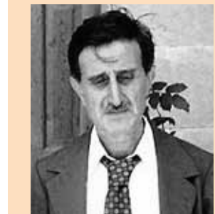
كمال جنبلاط في مختارات شعرية غير منشورة ١٢