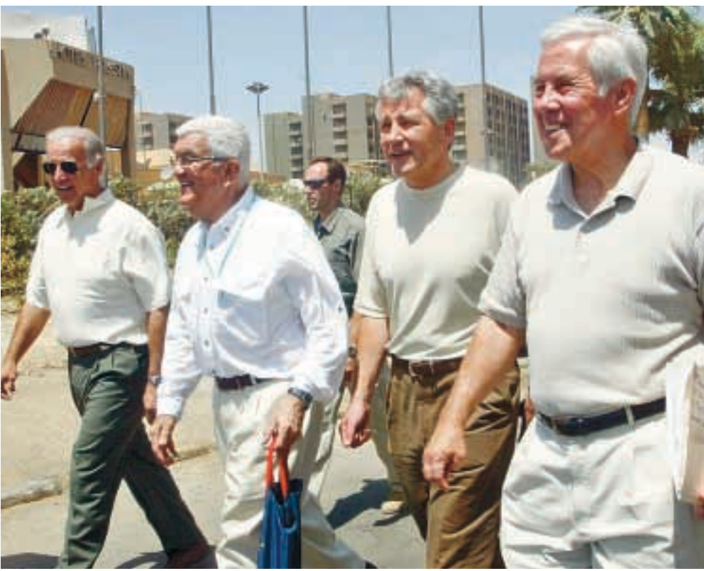
ثلاثة من مجلس الشيوخ الأميركي ريتشارد لوغار وشاك ماجل وجوزيف بينن متوجهون إلى فندق «فلسطين» في بغداد.