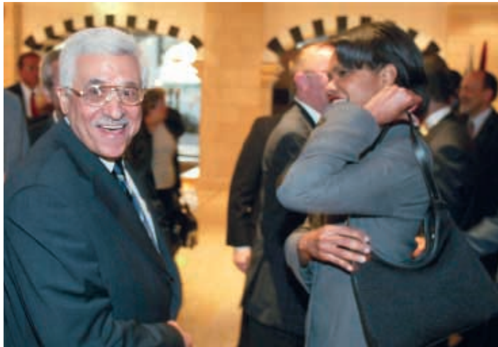
كوندوليزا رايس و«ابو مازن» قبيل بدء المحادثات امس في أريحا.