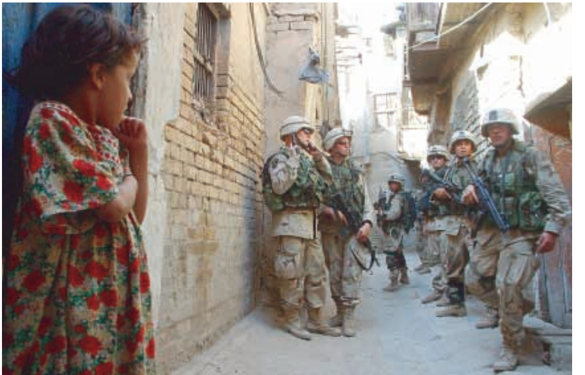
جنود اميركيون خلال مطاردة في أحد أحياء بغداد.