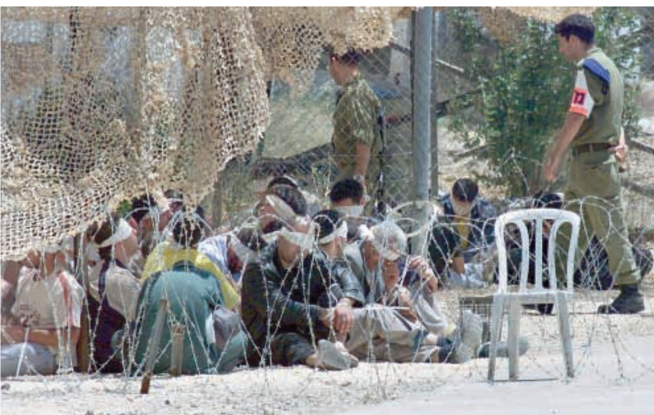
القدس المحتلة - سائدة حمد - القاهرة - محمد الشاذلي - غزة - فتحي صباح - الناصرة - أسعد تلحمي

تسببت إسرائيل في إرجاء «حركة المقاومة الإسلامية» (حماس) إعلان قرارها النهائي بمهد للبدء بتطبيق خريطة الطريق، إذ شنت أمس حملة اعتقالات جماعية وعائلية، في مدينة الخليل طالوت ١٥٠ فلسطينياً في صفوف حركة «حماس»، ومع ذلك توشك المحادثات الامنية بين الاسرائيليين والفلسطينيين أن تتوصل الى اتفاق. (راجع ص ٥) وجاءت حملة الاعتقالات هذه في وقت أعلن مساعد وزير الخارجية الاميركي لشؤون الشرق الاوسط وليام بيرنز انه ابلغ الرئيس المصري حسني مبارك أمس ان الرئيس جورج بوش لديه «تصميم شخصي» للتحرك قديماً من أجل تنفيذ